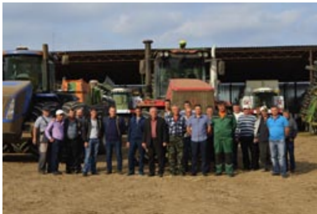
Трудовой коллектив ООО «Спасское»

В ООО «Спасское» первыми в холдинге завершили сев озимой пшеницы. Посевная продолжалась восемь суток – работы велись в две смены.