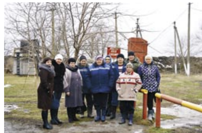
Трудовой коллектив тока ООО «Барханчакское»

Предприятия работают на земле и платят налоги в бюджет. Почти каждое хозяйство в «АСБ» – ключевое для своего населенного пункта. А значит – если растет хозяйство, растет и уровень жизни в селе, дороги становятся качественнее, улучшается инфраструктура. Населенный пункт, в котором живут люди, преобразуется.